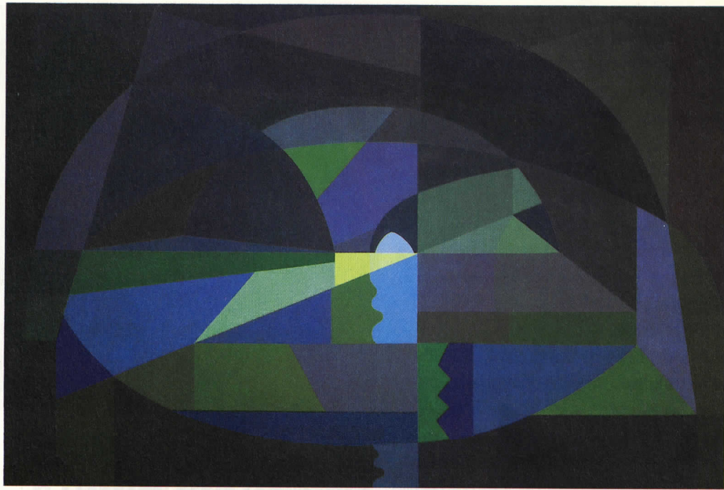
“La grotta azzurra” - 1958” 97 x 146 cm. Oleo s/tela. Colección Fundación Pettoruti.

El 13 de octubre de 1924 en el Salón Witcomb de Buenos Aires, realiza Pettoruti su primera muestra luego de once años de ausencia. Sus obras decididamente vanguardistas para la época, provocan un escándalo de proporciones. Se alínean tras él los jóvenes artistas Mantinfierristas, entre ellos Córdova Iturburu, Xul Solar y Jorge Luis Borges. El público y la prensa discuten airadamente; llegando ocasionalmente a protagonizar verdaderas batallas campales.