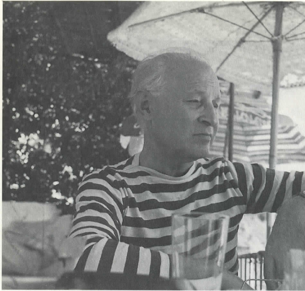
Pettoruti en Capri, 1958.