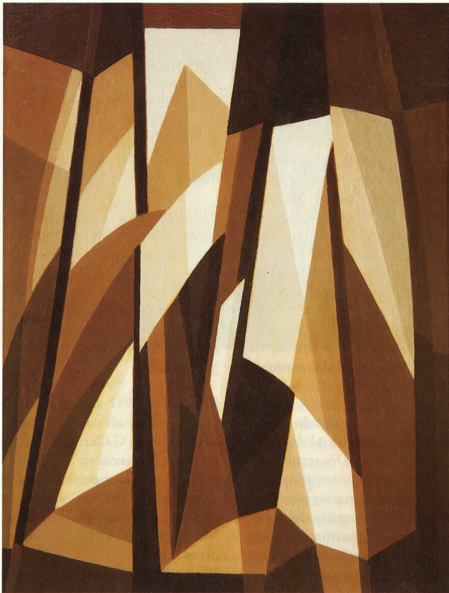
"Vallombrosa" - 1916, 33 x 24 cm. Oleo s/cartón. Colección Fundación Pettoruti.

exposiciones; en 1960 en la Molton Gallery de Londres, el Walker Art Center de Minneápolis, Denise René de París, etc.